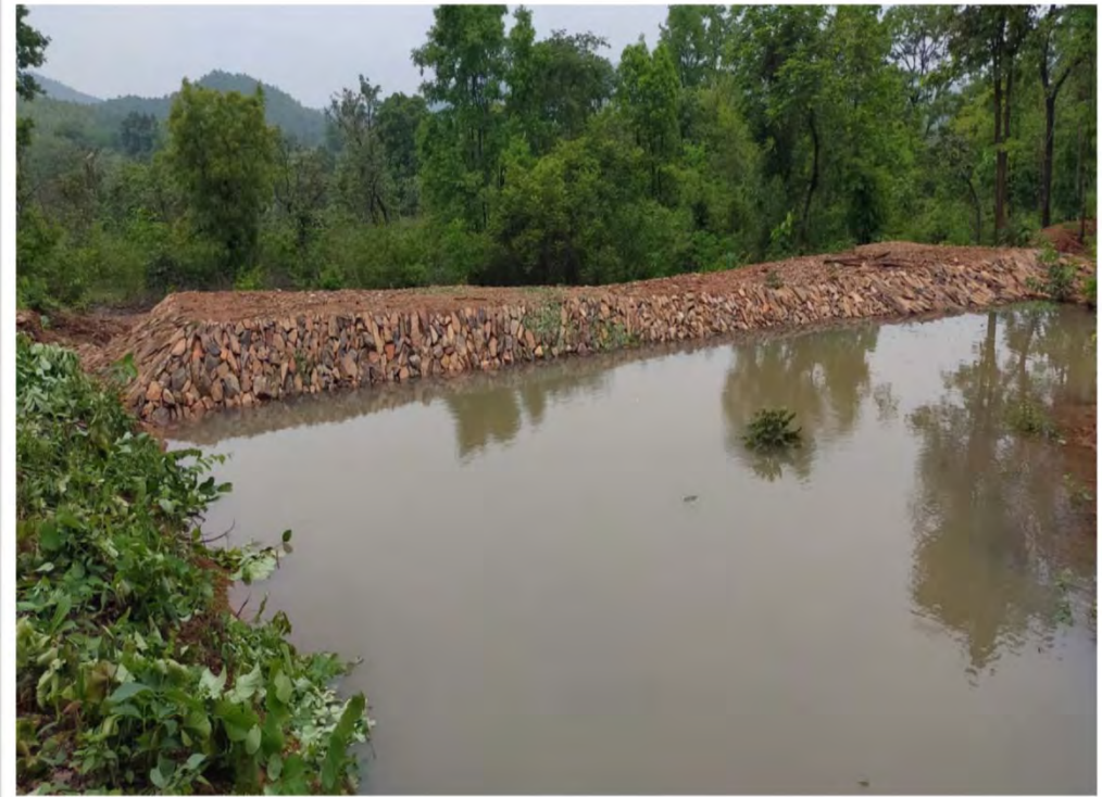
Ichahatu PF (2020-21)