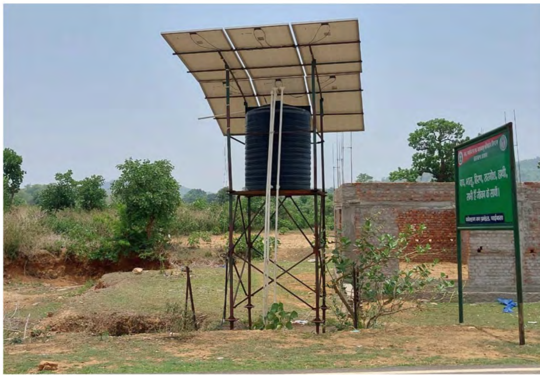
Solar Jal Minar , Gitilipi