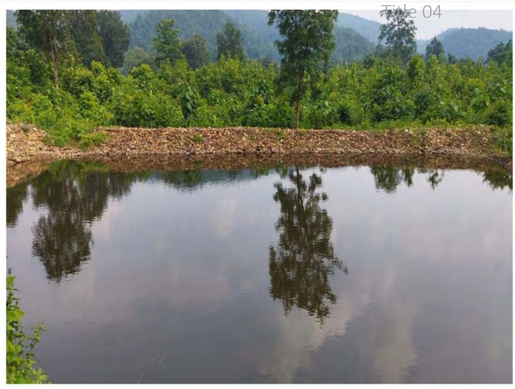
Saitwa RF (2019-20)