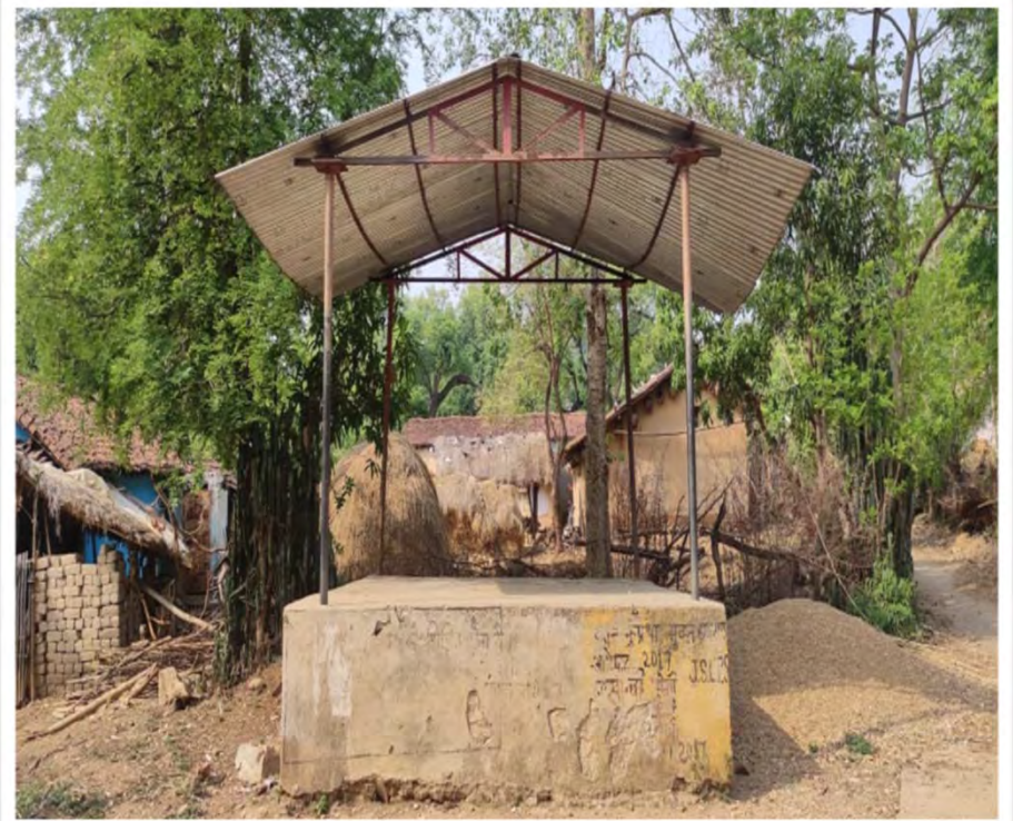
Platform, Bada Lagia