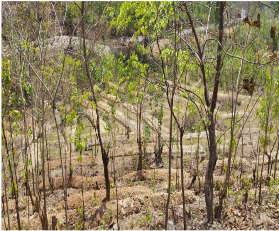
Dimbuli RF (2021-22)