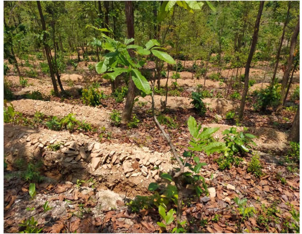
Ichahatu PF (2019-20)