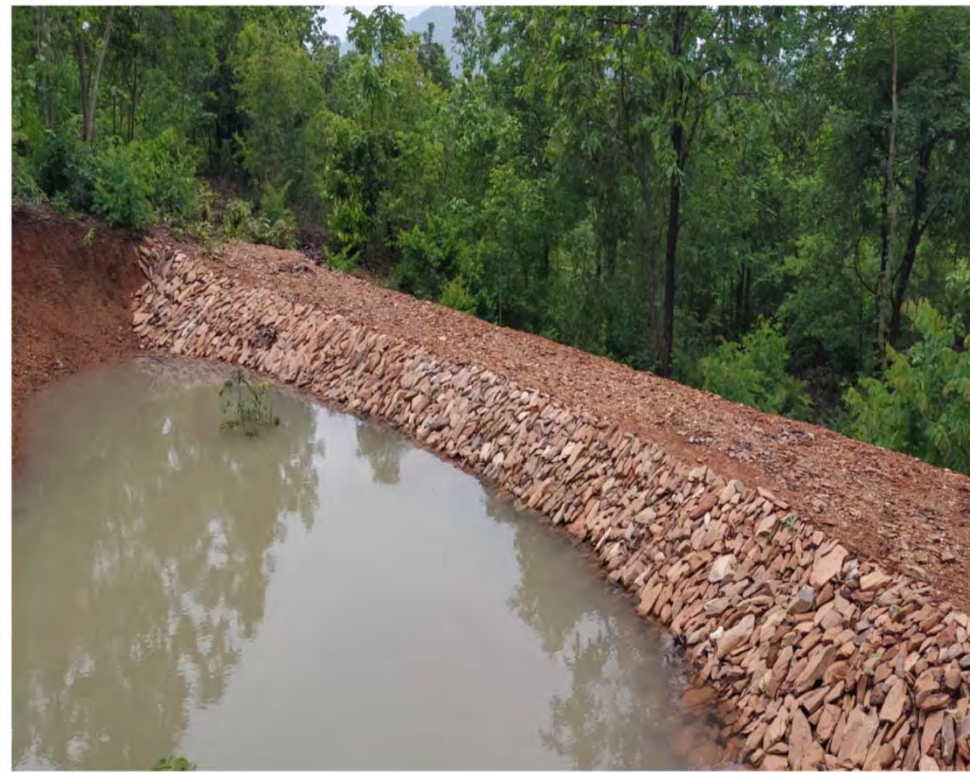
Kaida, Saitwa RF (2019-2020)