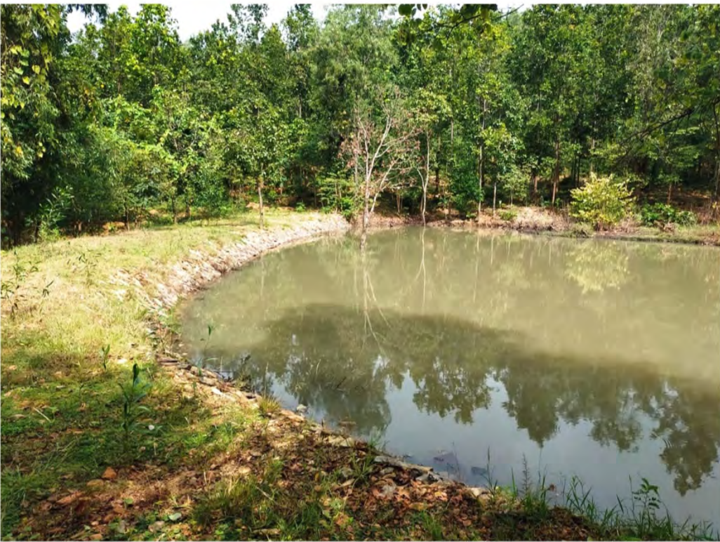
Ichahatu PF (2019-20)